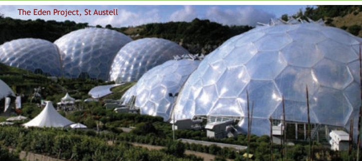
The Eden Project, St Austell

Designed und produziert von karenjacksondesign.com