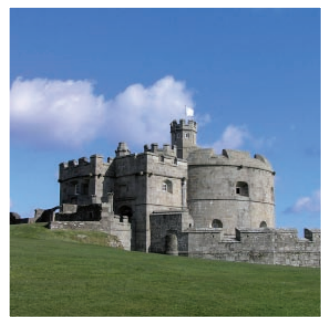
Pendennis Castle, Falmouth