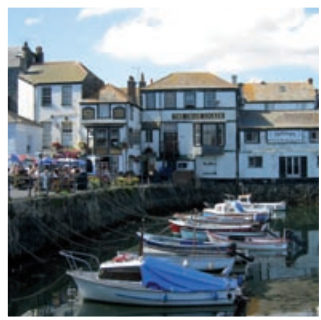
Custom House Quay, Falmouth